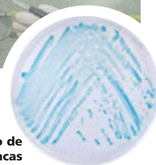
Desarrollo de E. sakazakii en placas de agar

Este análisis, útil para comprobar la inocuidad de un alimento tan especial como son las fórmulas infantiles para lactantes, se encuentra dentro de la oferta de servicios del centro desde de junio de este año. Para solicitar este servicio contactarse con el Centro INTI-Lácteos Rafaela.