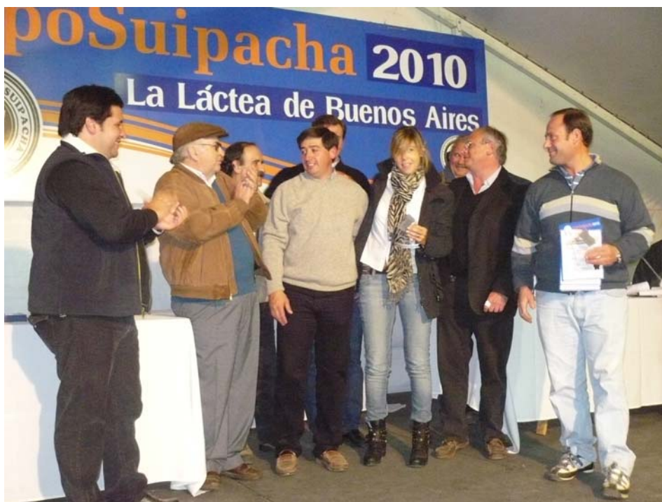
Entrega de premios