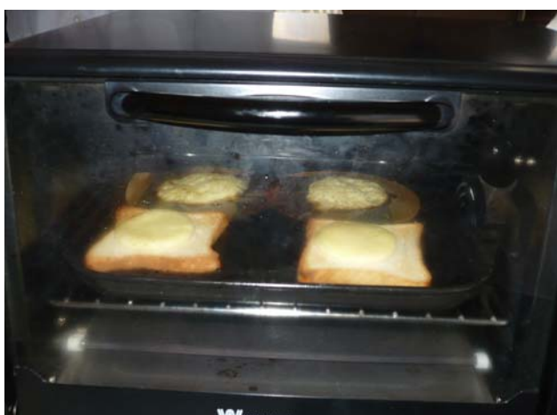
Horno utilizado para realizar el ensayo de propiedades funcionales de queso Mozzarella