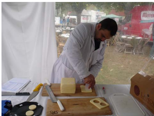
Preparación de muestras para el ensayo de propiedades funcionales de queso Mozzarella