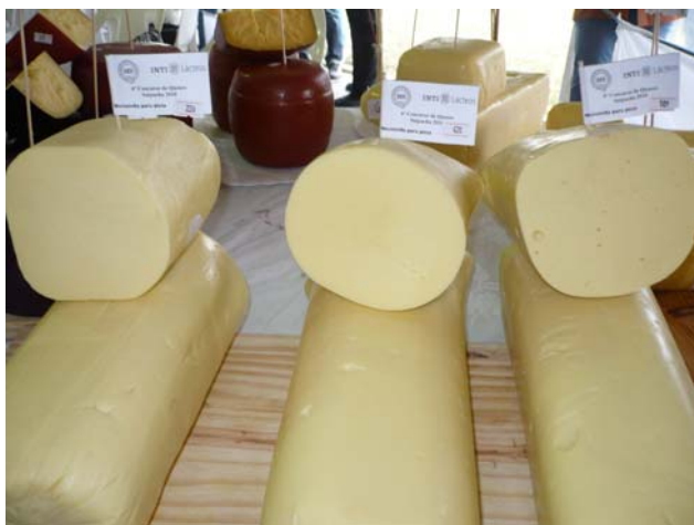
Apariencia de quesos Mozzarella