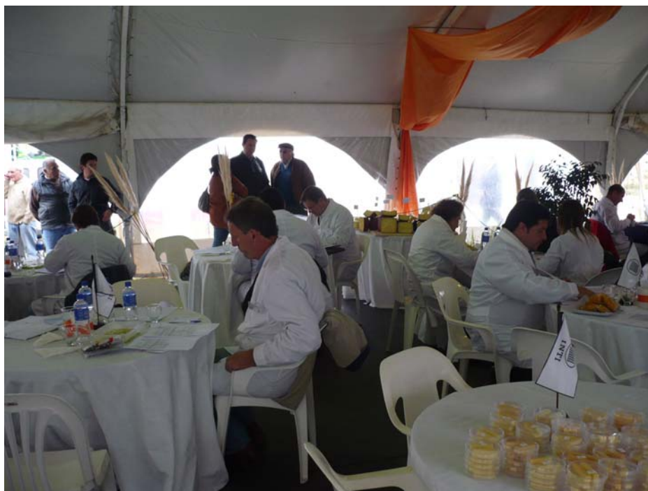
Desarrollo de la jura