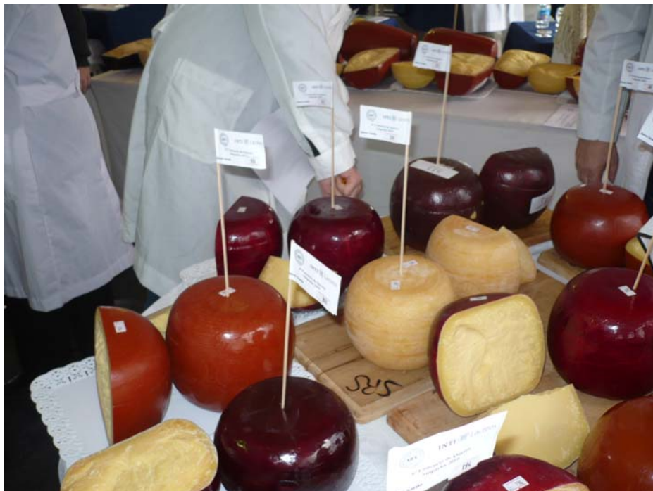
Evaluación de apariencia de quesos duros