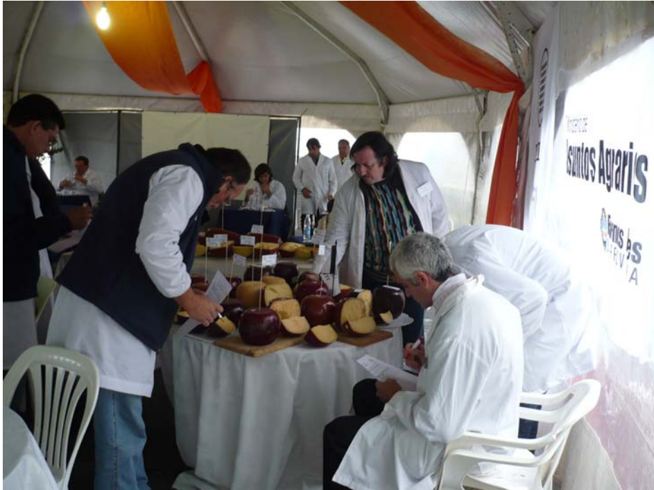
Evaluación de apariencia de quesos duros