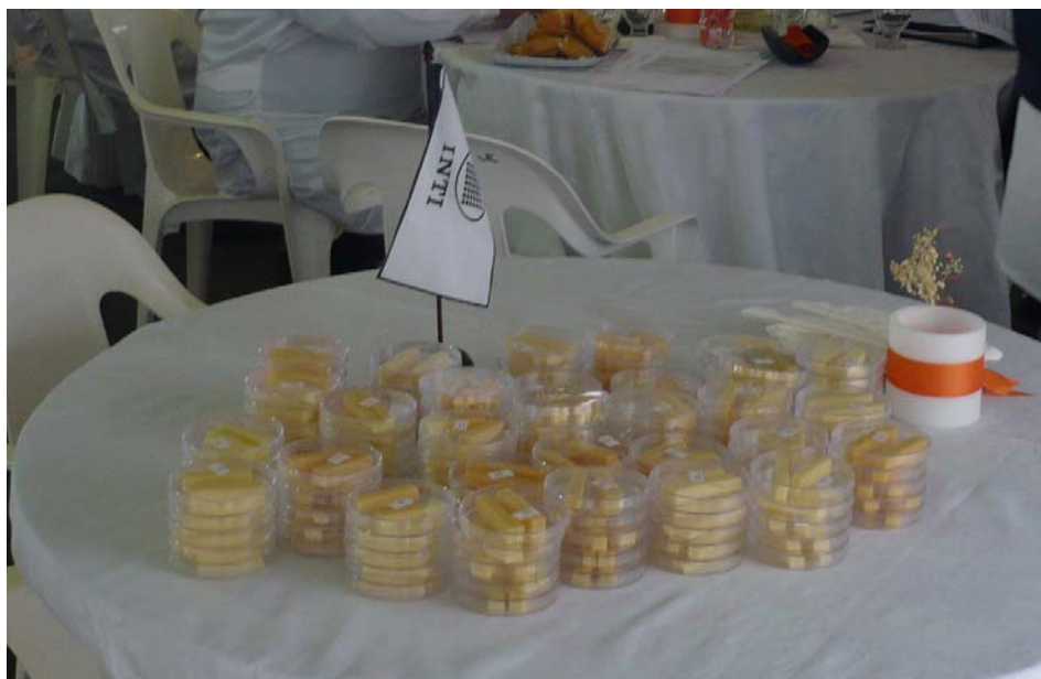
Muestras destinadas para la evaluación del flavor y la textura